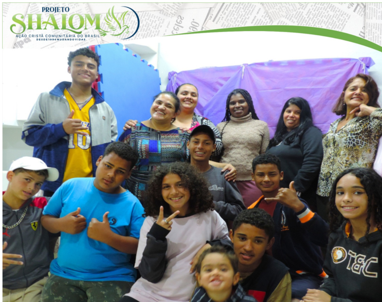
Equipe de produção documental - Unidade Miami